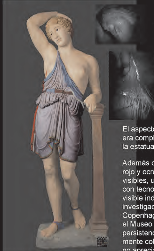
Recreación digital de la policromía original probable de la "Amazona herida" de Écija (A. Mavrogianni / Museo Histórico Municipal de Écija)

Examen de la Amazona de Écija por luminiscencia visible inducida (proyecto Tracking colour , Ny Carlsberg Glyptotek/ Museo de Écija). Los puntos brillantes indican la persistencia del pigmento "azul egipcio".