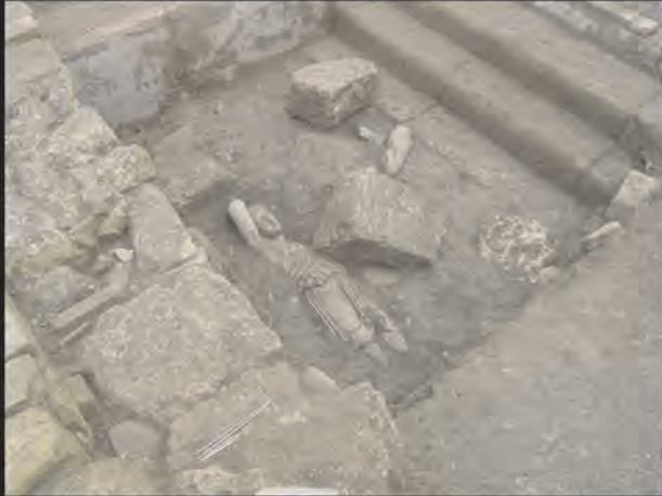
La Amazona in situ en el momento de su hallazgo

El conjunto monumental parece haber sido anulado entre los ss. IV y V d.C. Por encima, se excavó un enorme cementerio musulmán (siglos IX-XIII) con más de 5.000 enterramientos islámicos, que se conservan en el Museo de Écija: una de las mayores colecciones antropológicas del mundo.