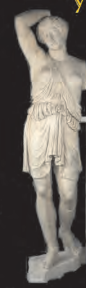
Ny Carlsberg Glyptotek (Copenhague)