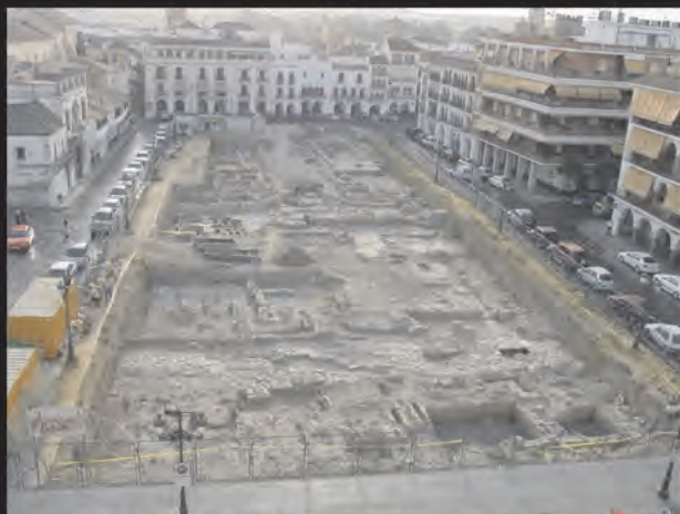
La Plaza de España de Écija durante las excavaciones

El conjunto monumental parece haber sido anulado entre los ss. IV y V d.C. Por encima, se excavó un enorme cementerio musulmán (siglos IX-XIII) con más de 5.000 enterramientos islámicos, que se conservan en el Museo de Écija: una de las mayores colecciones antropológicas del mundo.