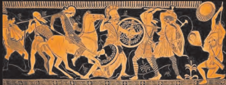
Batalla entre griegos y amazonas ( amazonomaquia ) en un vaso de cerámica ática de "figuras rojas".

Las amazonas eran personajes mitológicos relacionados con la diosa Artemisa (Diana). En contraposición al ideal femenino de la Antigüedad clásica, eran mujeres fuertes, bravas guerreras, hábiles a caballo y con el arco, semi-salvajes e independientes de los hombres.