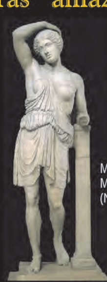
Metropolitan Museum (Nueva York)

La "Amazona herida" de Écija, fechada en el primer tercio del siglo II d.C., es una de las cuatro copias romanas de un prototipo griego clásico del período severo (siglo V a.C.): el conocido como amazona sciarra , acaso atribuible a Policeto, Crésilas o al propio Fidias. De este prototipo existían anteriormente tres ejemplares similares en museos tan importantes como el Metropolitan Museum de Nueva York, Pergamon Museum de Berlín y Gliptoteca Ny Carlsberg de Copenhague.