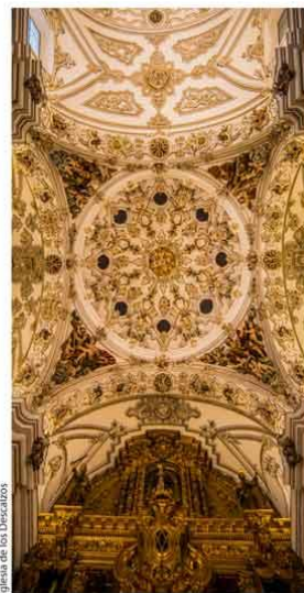
Capilla de los Descalzos

Ayuntamiento: 955 900 000 Policía Local: 092 Policía Nacional: 091 - 955 905 550 Guardia Civil: 955 900 698 Emergencias: 112 Bomberos: 080 Centro de Salud Virgen del Valle: 955 074 200 Centro de Salud El Amoroso: 955 879 364 Pantada de Taro: 954 832 202 - 619 356 264