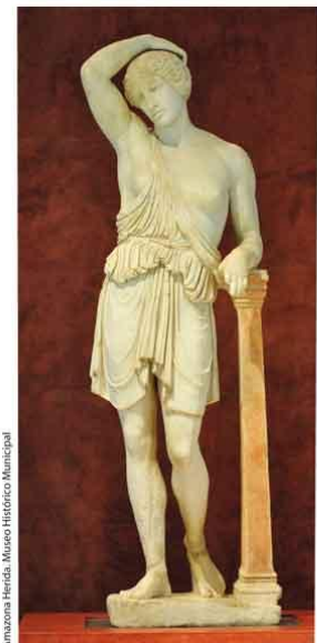
Amazona Herida. Museo Histórico Municipal

Iglesia y torre barroca del siglo XVIII. Destaca una interesante colección arqueológica en el claustro, con piezas de diferentes épocas y califato.