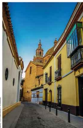
Calle Fernandez Pintado

En mayo de 1240 Écija fue conquistada por Fernando III y repartida entre nuevos pobladores castellanos, entre ellos muchos nobles, las órdenes militares y la Iglesia. Todo el siglo XVIII, considerado "el siglo de oro ecijano", Écija vive un esplendor de