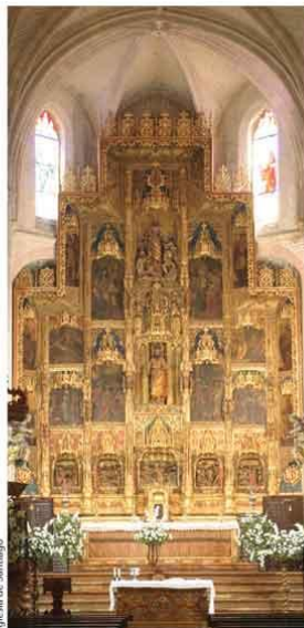
Iglesia de Santiago

construcciones civiles y religiosas. El casco histórico de Écija conserva uno de los mejores legados de arquitectura y arte barroco de Andalucía y, probablemente, de toda la Península Ibérica: palacios, iglesias (con las torres que han hecho famosa a la ciudad), conventos, edificios públicos y casas-palacio que constituyen un patrimonio histórico excepcional.