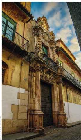
Palacio de Peñaflor

Uno de los máximos exponentes de la arquitectura civil barroca de Andalucía. En su interior se encuentra el Museo Histórico Municipal, con excepcionales piezas romanas como la Amazona Herida y una amplia colección de mosaicos.