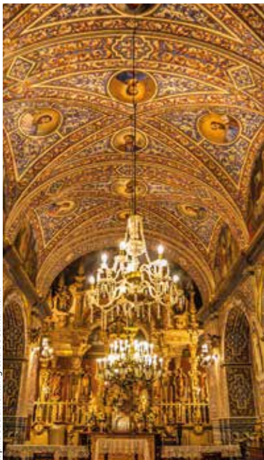
Capilla Sacramental Iglesia de Santa María

Ayuntamiento: 955 900 000 Policía Local: 092 Policía Nacional 091 - 955 905 550 Guardia Civil: 955 900 698 Emergencias: 112 Bomberos: 080 Hospital de Alta Resolución de Ecija: Teléfono: 955 87 90 01 Centro de Salud "Virgen del Valle": 955 074 200 Centro de Salud "El Almorán": 955 879 304 Parada de Taxis: 954 832 502 - 619 356 264