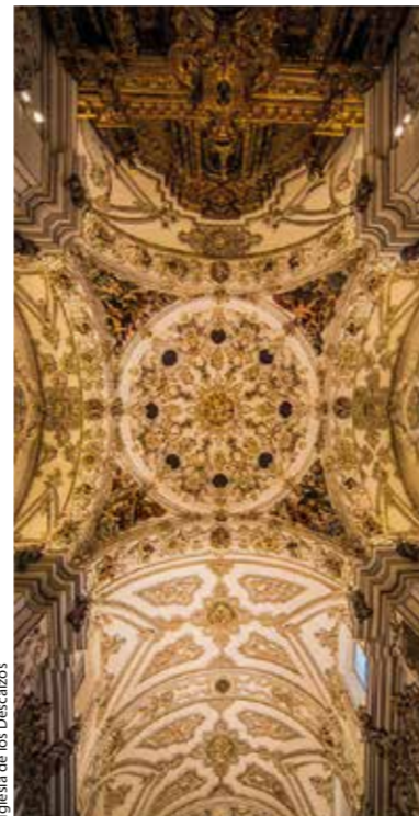
Iglesia de los Descalzos

decoración excepcional de pinturas murales.