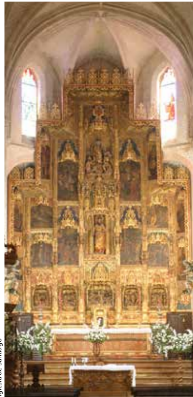
Iglesia de Santiago

Todo el siglo XVIII, considerado "el siglo de oro ecijano", Écija vive un esplendor de construcciones civiles y religiosas. El casco histórico de Écija conserva uno de los mejores legados de arquitectura y arte barroco de Andalucía y, probablemente, de toda la Península Ibérica: palacios, iglesias (con las torres que han hecho famosa a la ciudad), conventos, edificios públicos y casas-palacio que constituyen un patrimonio histórico excepcional.