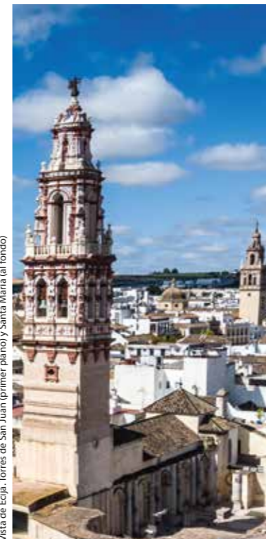
Vista de Écija. Torres de San Juan (primer plano) y Santa María (al fondo)

La fiesta más importante de Écija es la Semana Santa, declarada de Interés Turístico Nacional. También destacan fiestas como la procesión de San Pablo el 25 de Enero y la procesión de la Virgen del Valle el 8 de Septiembre, patronos de la ciudad. En febrero se celebra el desfile de Carnaval. En el mes de Junio la procesión del Corpus Christi, día en el que las calles se llenan de romero y se adornan los zaguanes de las casas con altares y flores. A mediodía de Septiembre tiene lugar la Feria de Écija y el Concurso de Arte y Elegancia a Caballo. Por otro lado, resaltar otros eventos como el Descenso del Batán y Fiesta de la Piragua en Junio, la Noche Flamenca Ecijana y Ciclo de Música en los Palacios en Julio, y el programa Écija Ciudad Barroca en Diciembre.