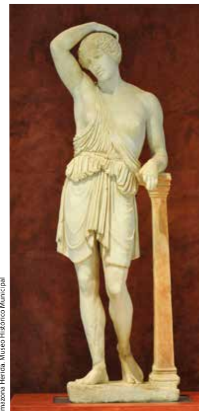
Amazona Herida. Museo Histórico Municipal

Iglesia y torre barroca del siglo XVIII. Destaca una interesante colección arqueológica en el claustro, con piezas de diferentes épocas y culturas. La capilla sacramental ofrece una