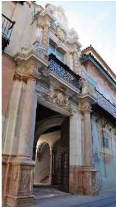
Palacio de Peñaflor